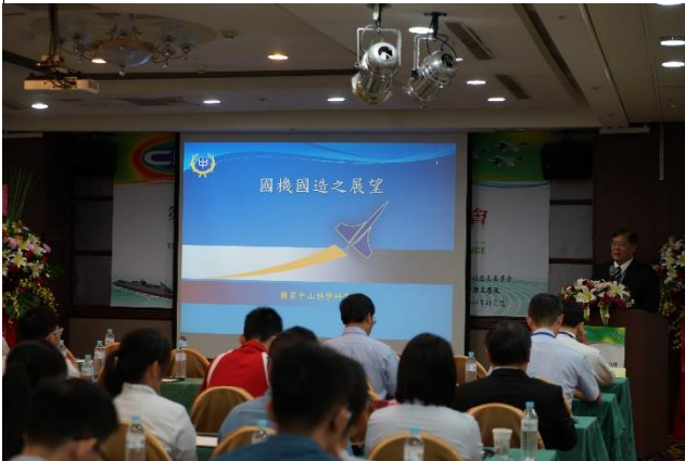
與會貴賓專心聆聽