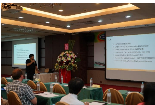
虎門科技股份有限公司