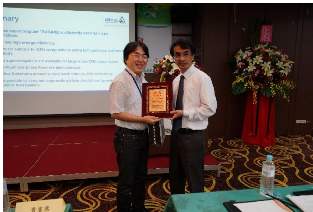
吳宗信教授頒發禮品感謝 AOKI 教授