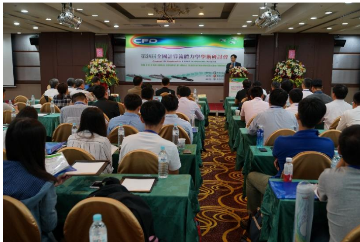
致詞時臺下專心聆聽