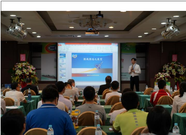
大會演講主持人2-荊元宇將軍