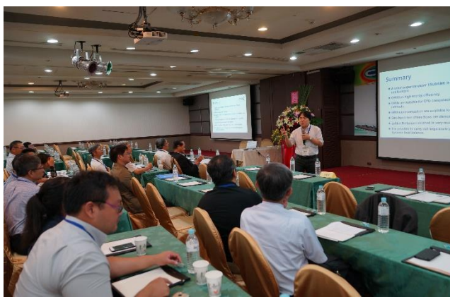
與會人員專注聆聽