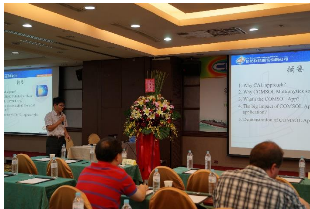
皮托科技股份有限公司