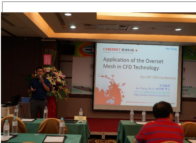
思瀚科技股份有限公司