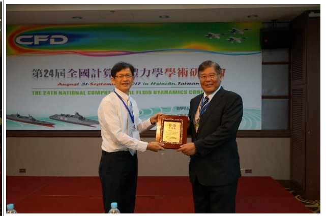
荊元宇將軍頒發感謝狀