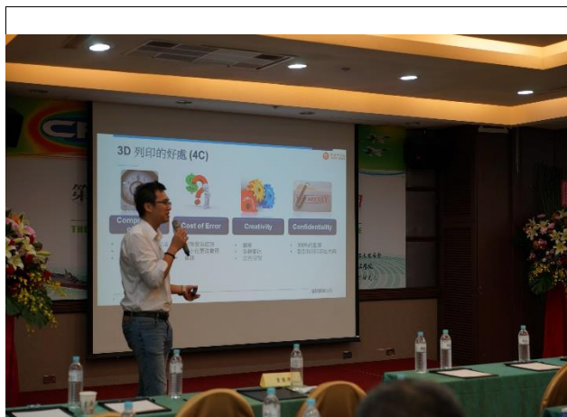
普立得股份有限公司