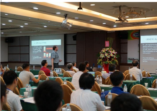
迷你論壇 1 - 李文樺教授演講