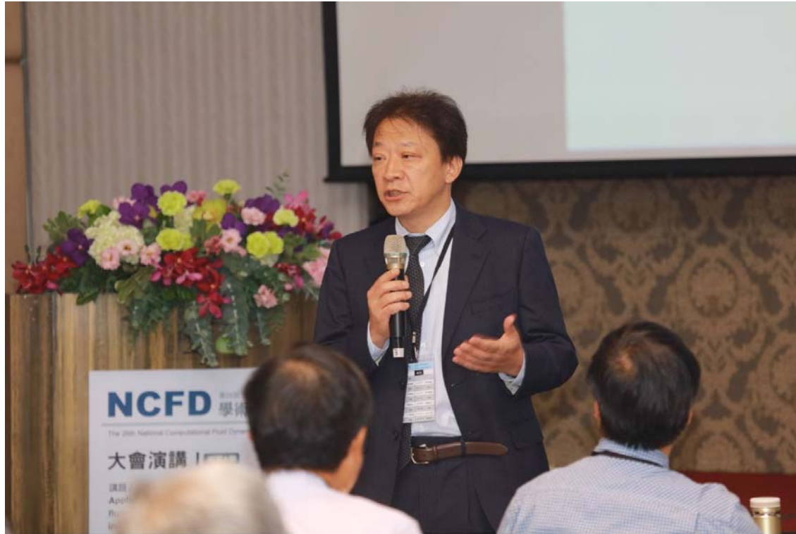
大會邀請演講(Plenary speech)-日本東京大學工業科學所 Chisachi Kato 教授 講題: Applications of very large scale fluid-flow computations to industrial problems