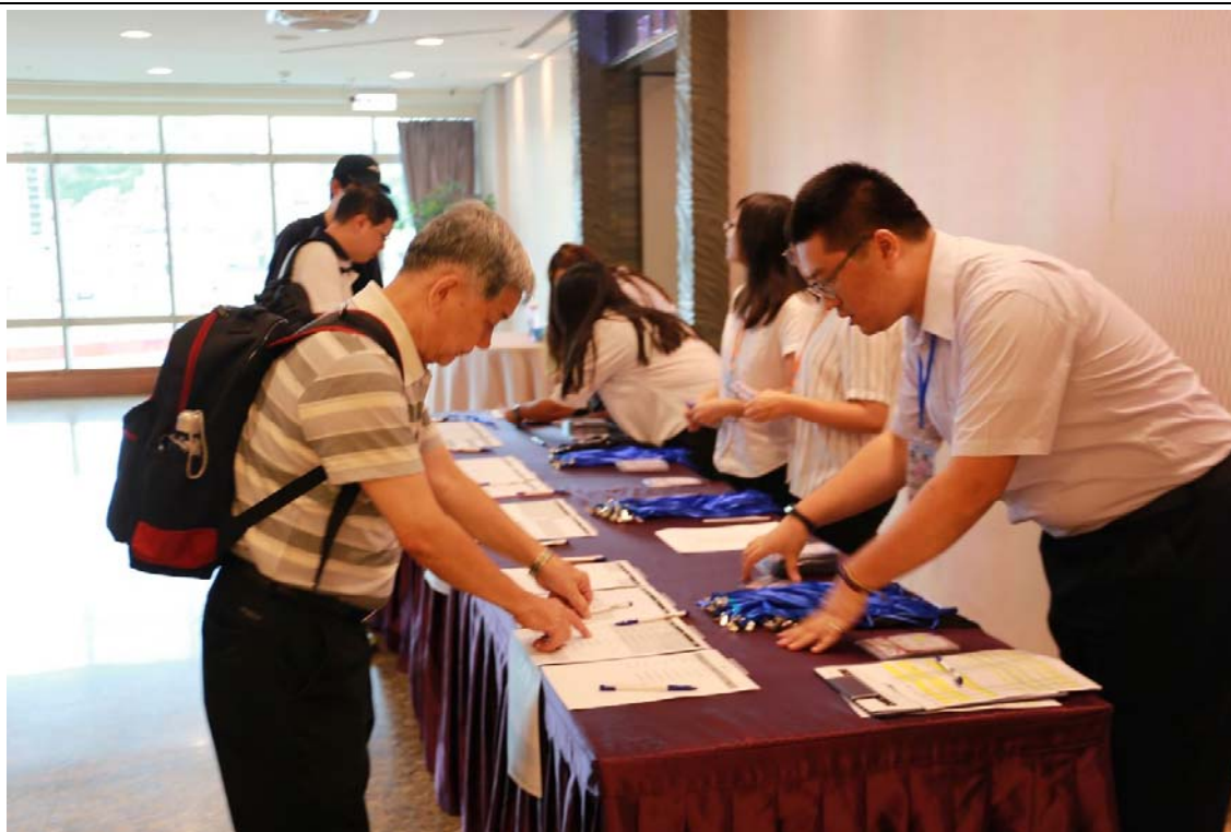
研討會註冊與報到