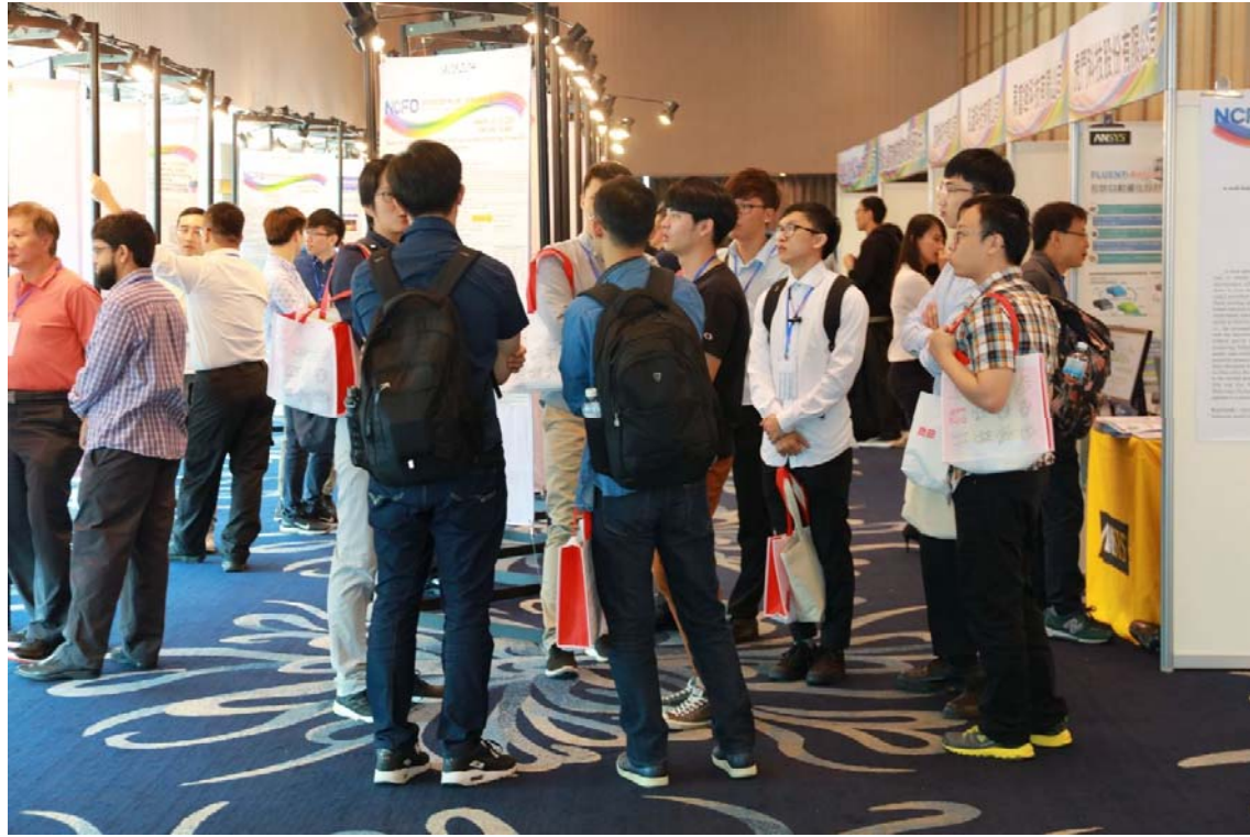
論文海報展示時間