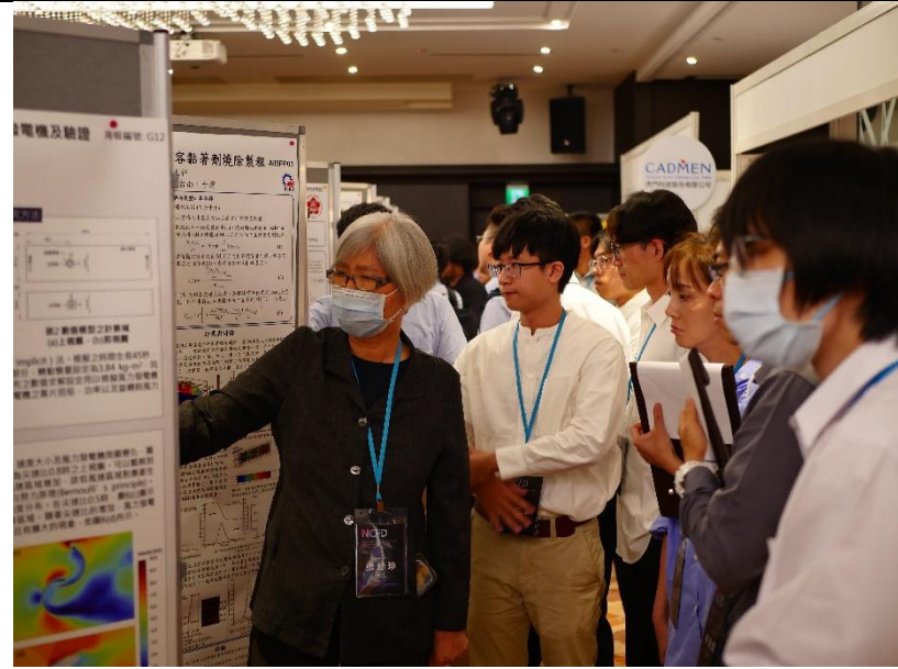
論文海報展示時間